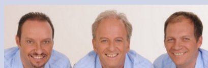
Am Freitagabend live im Festzelt: Die Calimeros.

Am Auffahrtswochenende 2009, also vom 21. bis 24. Mai 2009, findet in Wangen an der Aare das grosse